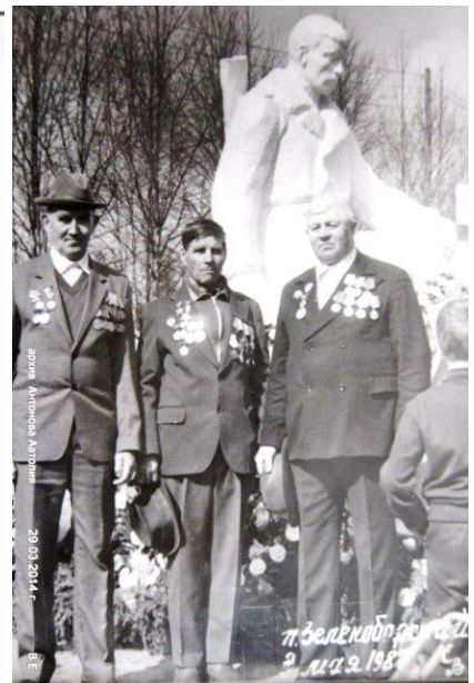
архив Антонова Аатолия