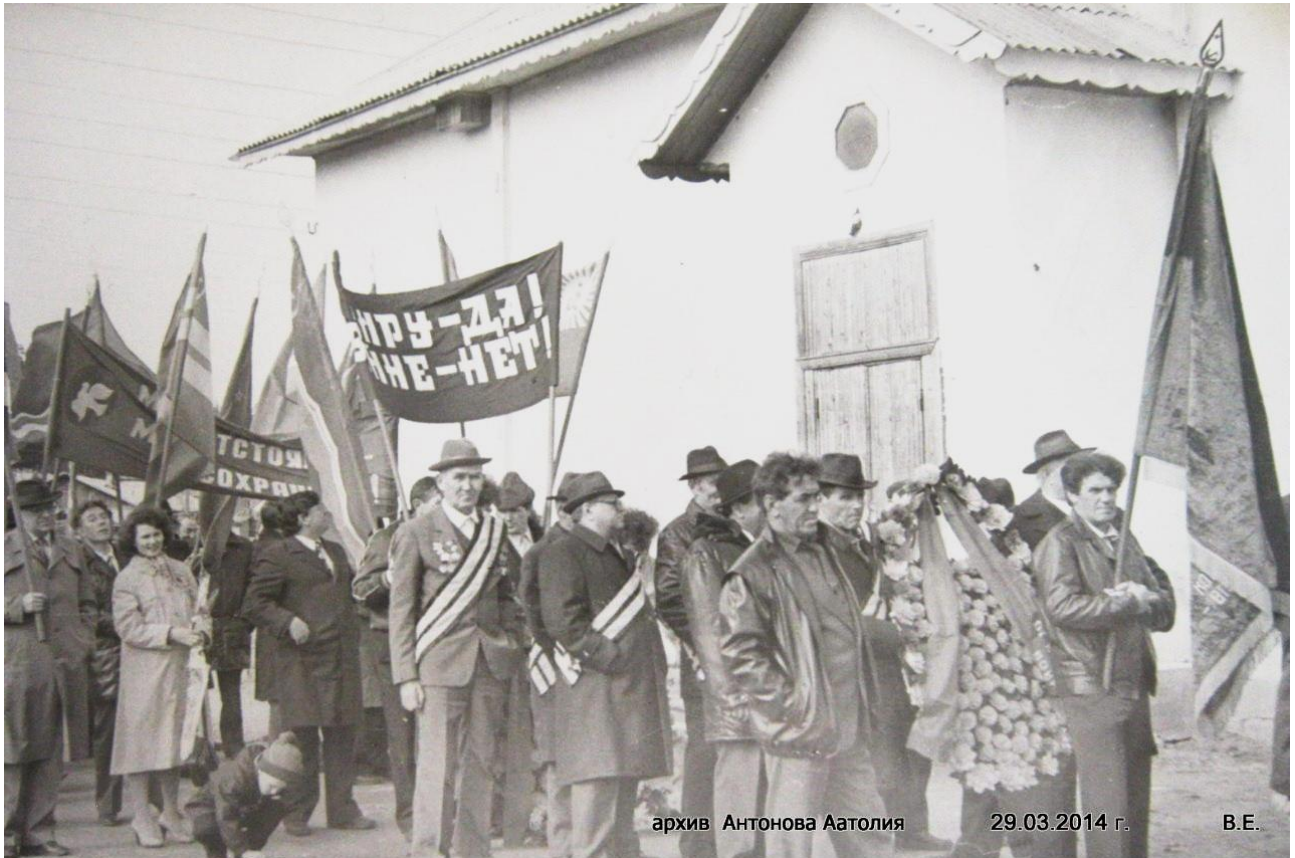
архив Антонова Аатолия